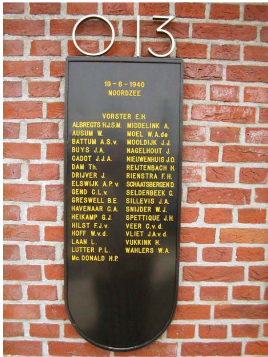
De namen van de overleden bemanningsleden.